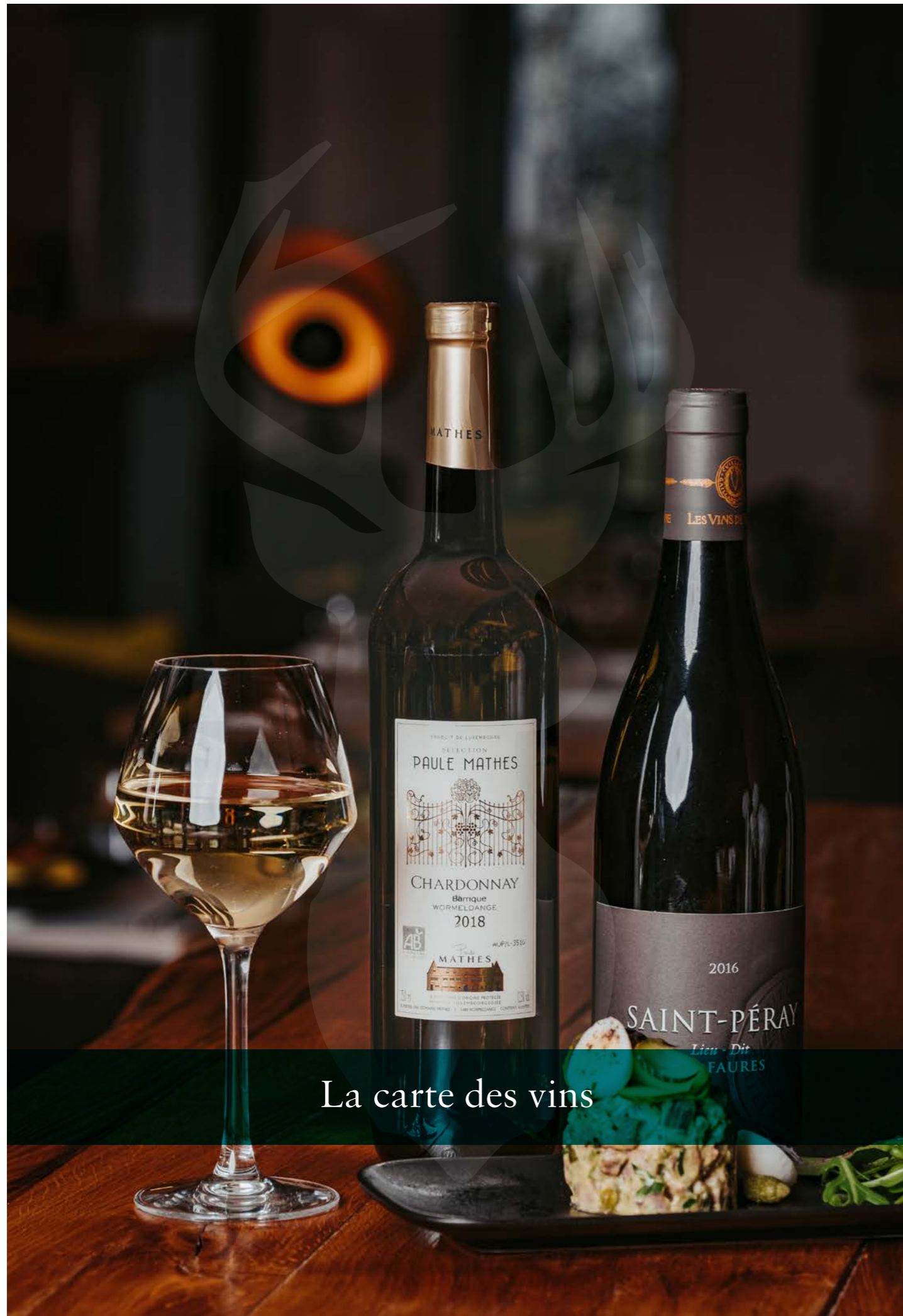
La carte des vins